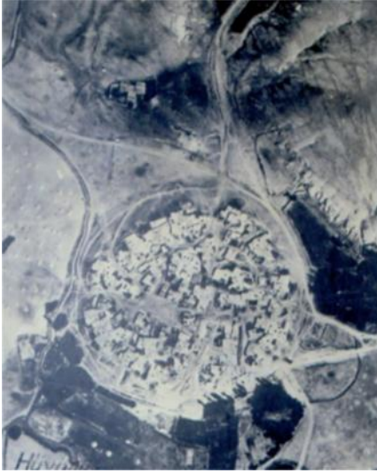
Figür 2: Alaca Höyük ve üzerindeki Höyük Köyü

İlk milli kazı olan Alaca Höyük kazısı, 22 Ağustos 1935 günü başladığı zaman, Höyük Köyü ören yerinin üzerinde bulunuyordu (fig. 2) . Bunu dikkate alan Alaca Höyük kazısının ilk başkanı Remzi Oğuz Arık, araştırmalarına köy meydanında ve ören yerinin çevresinde başlayabilmişti 9 (fig. 3). Kazının başlangıcından kısa bir süre sonra, Erken Tunç Çağı kral mezarlarından bazıları bulundu. Atatürk'ün emriyle ören yeri üzerindeki Alaca Höyük Köyü ovaya taşınmıştır. Ayrıca 1936 yılından itibaren de ilk milli kazının başkanlığı, Dr. Hamit Zübeyr Koşay'a verilmiştir. Kazının ikinci yılından itibaren Alaca Höyük'ün tabakalaşması belirlenerek, yayımlar buna göre yapılmaya başlanmıştır 10 .