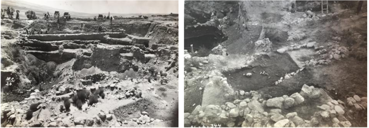
Figür 5 a-b: Alaca Höyük Eski Tunç Çağı krali mezarlarından genel görünüşler (Hamit Zübeyr Koşay arşivinden)

coğrafyada yaşayan yüksek bir kültürün varlığını ortaya koymuştur 22 . Gerek Mezopotamya yazılı kaynakları, gerek daha sonrasında Hitit yazılı kaynaklarından edindiğimiz bilgiler neticesinde bu yüksek kültürü yaratan halkın adı "Hatti" olarak anılmaktadır. Zira bu mezarlarda açığa çıkartılan standartlar, Güneş Kursları, altın, gümüş ve tunç kap kacaklar, takılar ve mobilya aksamaları, bilim alemi ve aydın kesimce çok iyi tanınmaktadır. Bunlar arasından özellikle standartlar/Güneş Kursları yanlış bir algılama ile "Hitit Güneş Kursları" olarak yaygın bir şekilde anılmaktadır. Halbuki bu eserler, Hititler'in Anadolu'ya gelişlerinden yaklaşık 300-350 yıl öncesine, Erken Tunç III evresine, bir başka deyişle Hatti Çağı'na aittir. Bu nedenle Alaca Höyük krali mezarları, Hatti prens ve prenseslerine ait olmalıdır. Ancak Erken Tunç Çağı III evresinde Alaca Höyük'te hüküm süren bir sülalenin üyeleri olarak kabul edebileceğimiz gömülenlerin kimliklerini, elbette henüz yazı kullanılmadığından bilemiyoruz.