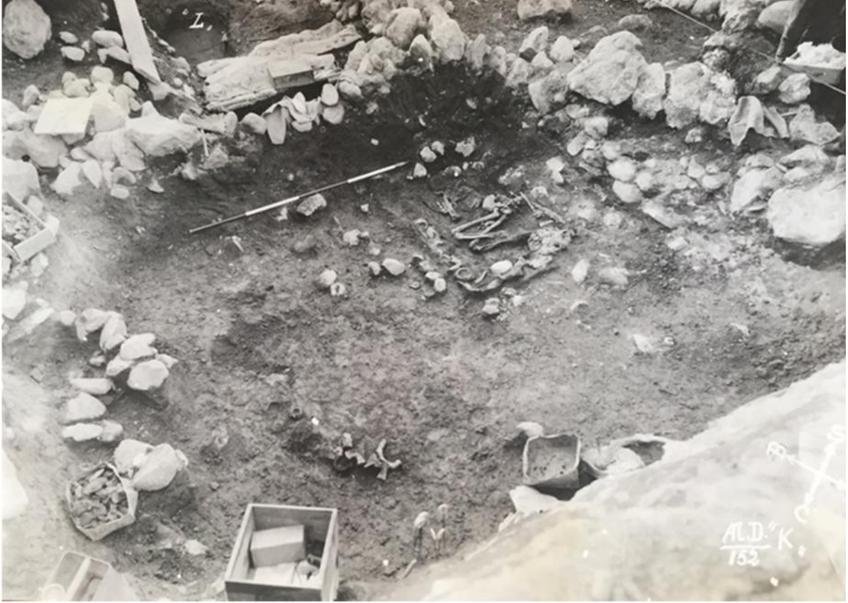
Figür 7: Alaca Höyük Eski Tunç Çağı krali mezarlardan genel görüntüler

sadece erkek mezarlarında bulunması biçimindeki düşüncenin cinsiyetin saptamasında bir hareket noktası olamayacağı açıktır 33 .