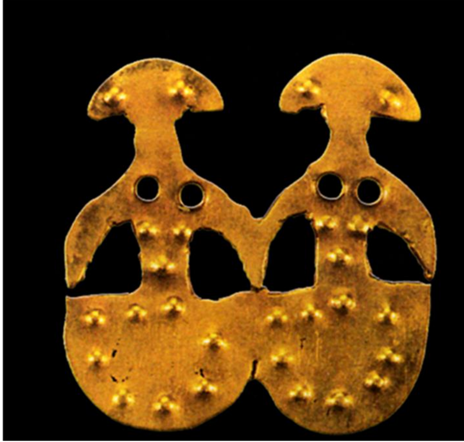
Figür 8: Alaca Höyük Eski Tunç Çağı krali mezarlarda bulunan ikiz idol

düşünülmektedir. Bu objenin altından yapılmış olan tekli bir benzeri ise Almanya-Karlsruhe Badischen Landesmuseum sergi kataloğu içinde yer almaktadır 46 .