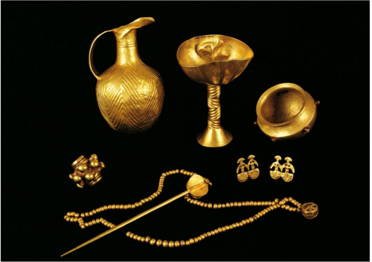
Figür 4: Alaca Höyük Eski Tunç Çağı krali mezarlarında ele geçen buluntulardan örnekler

Bu döneme ait çok önemli buluntular veren 13 mezar, höyüğün güney-doğu eteğinde doğu-batı yönlü bir yarığın doğu kesiminde ortaya çıkarılmıştır 20 . Yeniden eskiye 5., 6., 7. yapı katlarına ait olduğu düşünülen mezarların içerisine bırakılan ölü hediyeleri mezarlara kimlerin gömülmüş olabileceği yolunda yorumlar yapılmasına neden olmuştur. Altın ve gümüşün yoğun olarak kullanıldığı bu çağda belli merkezlerde, özellikle Alaca Höyük'te ele geçen buluntular nitelik ve nicelik açısından dikkat çekicidir (fig. 4). Alaşımli bakır kullanılarak değişik formlarda metalden dökülerek biçimlendirilmiş silahlar, dini inançları yansıttığı kabul edilen ve farklı geometrik formlardan oluşturulan semboller ile anatomik açıdan başarılı bir şekilde yapılmış hayvan figürleri yüksek düzeyde bir işçiliğe sahiptir. Ayrıca mezarlarda ele geçen altın-gümüş-elektrum gibi farklı metallerden elde edilmiş ve değerli taşlarla süslenmiş mücevherler, kadehler ve süsleme objeleri ise bu mezarlarda yatan elitist kesimin toplumsal statüleri hakkında bize bilgi de vermektedir. Alaca Höyük mezar buluntuları, Erken Tunç Çağı'nda sanat ve maden işçiliği ile önemini ve etkisini göstermiştir.