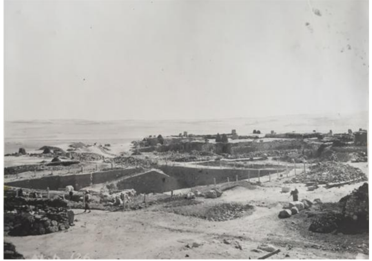
Figür 3: Alaca Höyük Kazıları'nın 1935-37 yıllarındaki görünümü (H. Z. Koşay arşivinden)

1935 yılında Erken Tunç Çağı'na tarihlenen üç krali mezara ilave olarak, 1936 yılında üç krali mezar daha bulunmuştur. Ayrıca, 2. kültür katı diye tanımlanan yapı katında bol miktarda Hitit Çağı'na ait eserler de ele geçmiştir 11 . 1937-1939 yılları arasında yapılan kazılarda ise daha önce bulunan altı mezara ilaveten yedi mezar daha eklenmiştir. Kalkolitik Çağ'dan, Demir Çağı'na kadar kesintisiz devam eden 14 ayrı yapı katının oluşturduğu kronolojiye sahip olan bu höyükte iki önemli kültür katmanı olan 2.3a-b ve 4a-b yapı katları Hitit dönemi kültürünü temsil ederken 5., 6., 7., 8. yapı katları Erken Tunç Çağı'na tarihlendirilmektedir. Bu iki kültür katmanında ele geçen buluntular Anadolu arkeolojisine önemli katkılar sağlamıştır.