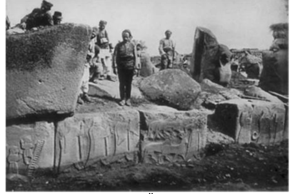
Figür 1a-b: Alaca Höyük'ün kabartmalı orthostat larının açığa çıkarılışı